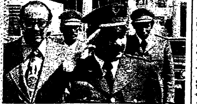
المعيد لشرف رئيس الوفد العسكري الجزائري لدى وصوله الى القصر الجمهوري مع الوفد امس، برفقة السفير الجزائري السيد محمد يزيد

الجزائرية مع المسؤولين اللبنانيين... تتناول تنفيذ مقررات مؤتمر وزراء... الدفاع العرب الذي عقد اخرا في... القاهرة. استقبل الرئيس سليمان فرنجية... في الساعة الواحدة من بعد ظهر امس،... الوفد العسكري الجزائري الذي يترؤ... ليتان رسميا برئاسة المعيد لشرف... ورفاق الوفد معجز الجزائري في لبنان... السيد محمد يزيد. وقد حضر القابلة... رئيس الحكومة رشيد الملاح. ويعد الاجتماع الذي استقبل... حوالي ساعة، دعا الرئيس فرنجية... اعضاء الوفد لتناول الغداء السي... ملاقاته، كما دعي للقاء ايضا،... والصدا اسكندر فقم، والعماد... نصرالله رئيس البرلمان وعدد من كبار... القياد. وقال سفير الجزائر السيد محمد... زيد، ان المباحث التي تجريها اللجنة